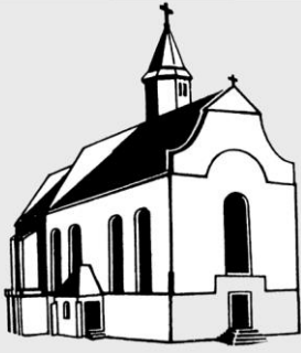
Deutschordensmünster St. Peter und Paul